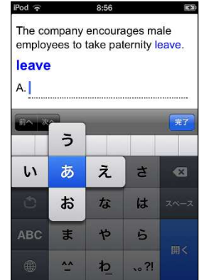
テンキーモード (フリック入力)